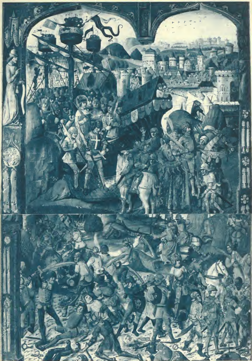
COMMENT LE ROI SAINT LOUIS ARRIVA EN LA CITÉ DE DAMIETTE, ET COMMENT, VOULANT RETOURNER A DAMIETTE, FUT PRIS